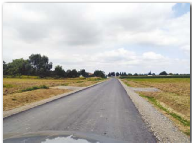
Nowa, przytorowa droga gminna