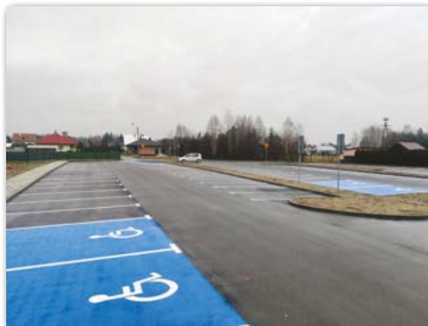
Parking w Trześni

Pozyskane dofinansowanie w ramach Rządowego Funduszu Rozwoju Dróg – zadania remontowe pozwoliło także na częściowy remont drogi gmin-