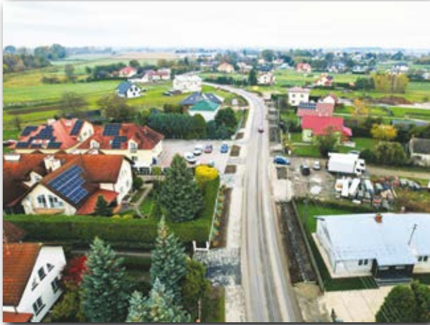
Chodniki w Złotnikach i Chrzastowie

na długości 2 kilometrów 247 metrów. Wartość inwestycji to 8 mln 420 tys. złotych, z czego dofinansowanie z Polskiego Ładu wyniosło 5 mln zł.