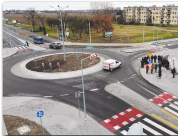
Rondo w Chorzelowie

Koszt całej inwestycji wyniósł łącznie 4,205 mln zł. Wkład Gminy Mielec to 650 tysięcy złotych,