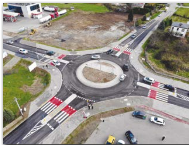
Rondo w Woli Mieleckiej

natomiast Powiat Miecki przekazał 2,053 mln zł, a Samorząd Województwa Podkarpackiego 1,502 mln zł.