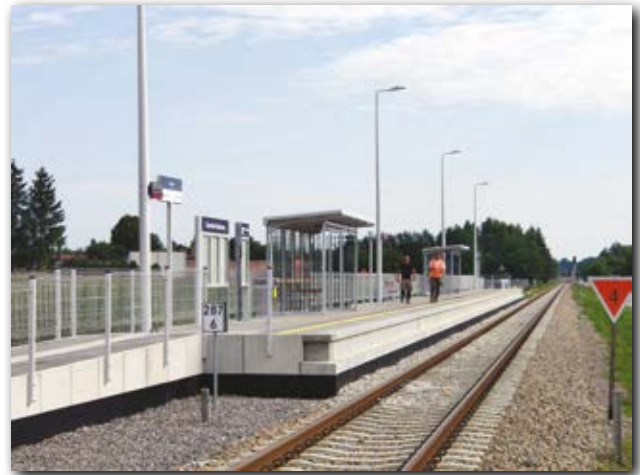
Dodatkowy przystanek PKP

Przeprowadzona rewitalizacji linii kolejowej L-25 to także przebudowa torowiska, nowa stacja