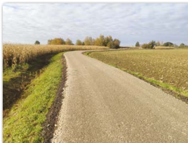
Remont drogi w Rzędzianowicach

nej nr 103-420R Książnice – Majdanek na odcinku około 0,88 km. Zadanie to obejmowało wykonanie nowej nawierzchni bitumicznej na długości 470m, wykonaniu nowych poboczy oraz regulację przepustów i rowów przydrożnych na całym odcinku. Łączna wartość inwestycji to 434 544,62 zł, z czego dofinansowanie stanowiło 260 726,00 zł.